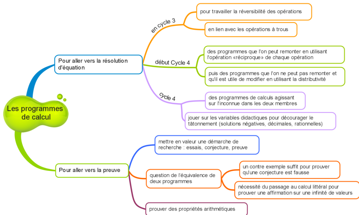
Figure n°2 : Potentialité des programmes de calcul pour des activités mathématiques

À travers cet exemple, nous avons voulu montrer un cycle de circulation de savoirs à l'intérieur du groupe aux étapes 1 et 2 : à partir du partage de savoirs provenant de la recherche, nous avons pu élaborer des principes communs et partagés, qui nous ont permis d'élaborer des activités de classe en lien avec nos objectifs de travail. Puis, à partir de questionnements venant du terrain nous avons dû modifier les activités produites en prenant en compte des contraintes d'enseignement. Cela nous a amené vers une nouvelle question de recherche (sur la place et le rôle de la distributivité) et vers la production de nouvelles activités (insérées dans des progressions) grâce à l'intégration de travaux de recherche plus récents (utilisation des programmes de calcul).